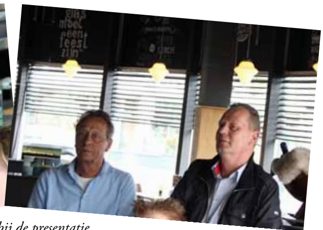
Aanwezigen bij de presentatie