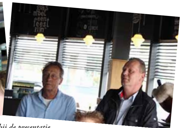
Aanwezigen bij de presentatie