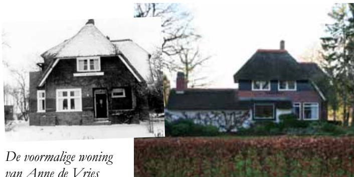
De voormalige woning van Anne de Vries