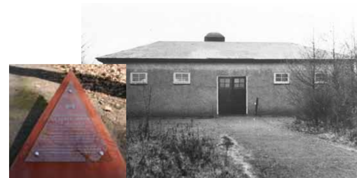
Het voormalig crematorium bij de fusilladeplaats, waar in 2015 een herdenkingsplaat, is geplaatst.