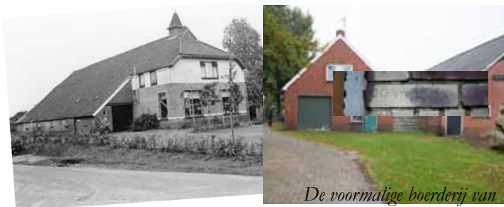
Links: Boerderij De Strank, Beilervaart 80

In de nacht van 18 op 19 oktober 1944 vond hier een overval plaats door NSB'ers. De zeven onderduikers, onder wie vijf joden, werden niet gevonden. Lammert Zwanenburg werd meegenomen naar het Schulthuis in Diever en op 19 oktober 1944 op de fusilladeplaats bij kamp Westerbork vermoord.