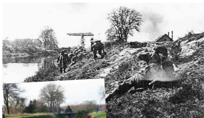
Bij de Halerbrug is op 12 april 1945 door Canadezen en Duitsers bevig gevochten.

6. U blijft over het fietspad langs de provinciale weg naar Hooghalen fietsen.