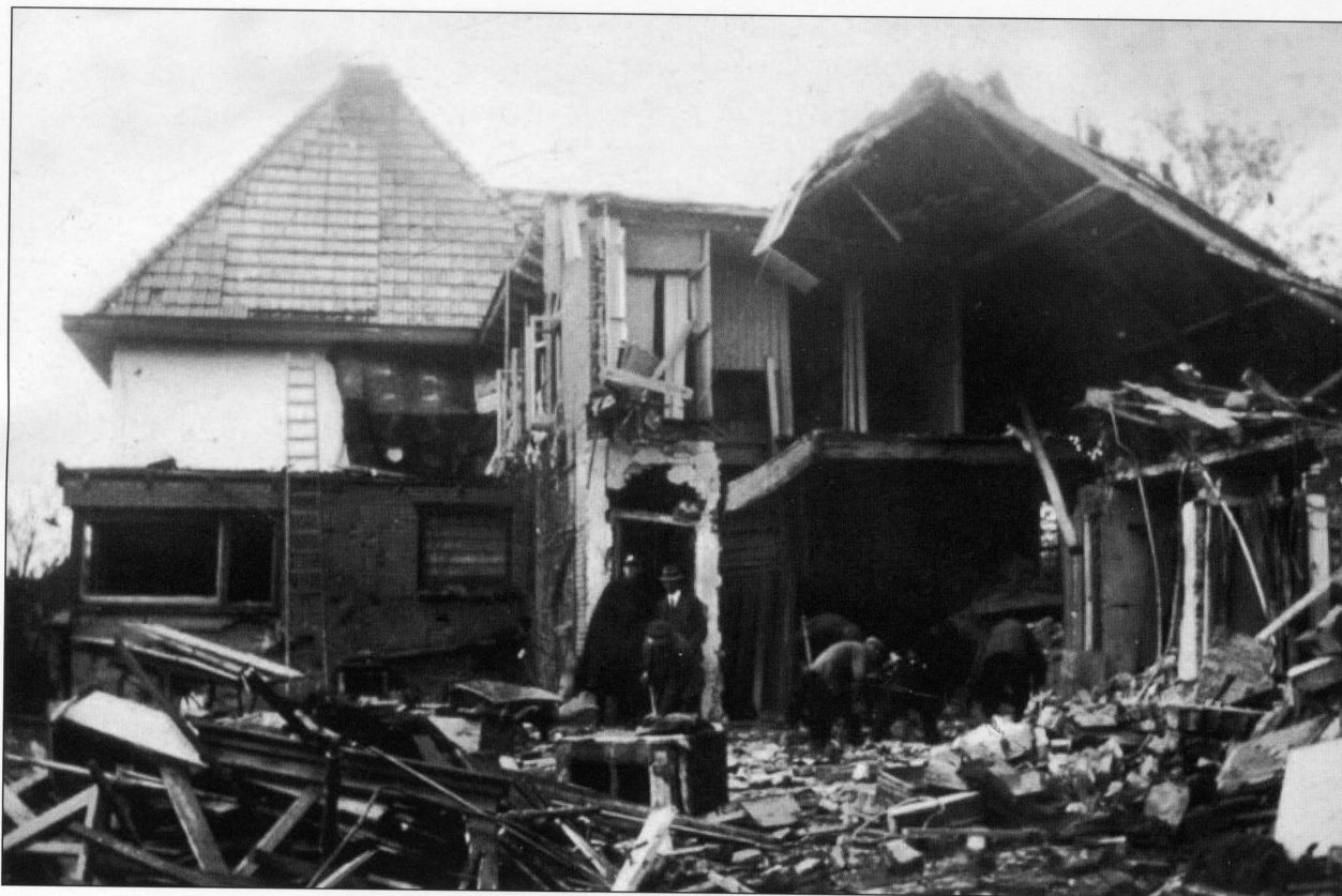
Achterkant van het gemeentehuis na het bombardement, 1941.