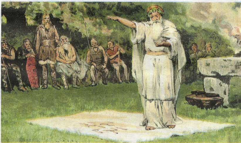
Een verbeelding van een volksvergadering van de Saksen.

Het boek Willehad, een Angelsaksische missionaris in Drenthe is te bestellen bij Uitgeverij Drenthe en te koop in de boekhandel.