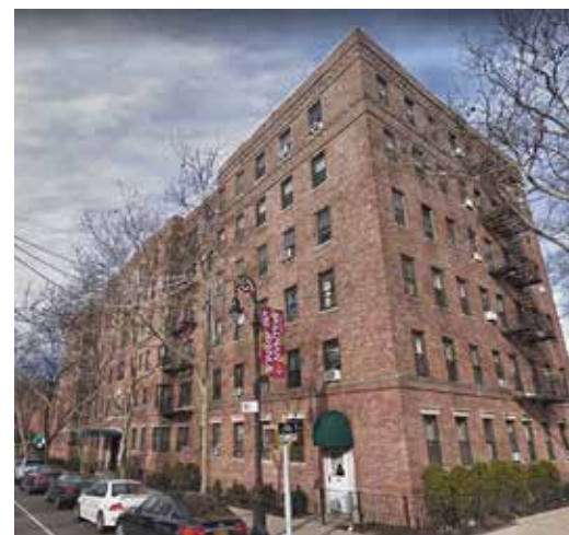
Rechts: Appartement van Palm in New-York