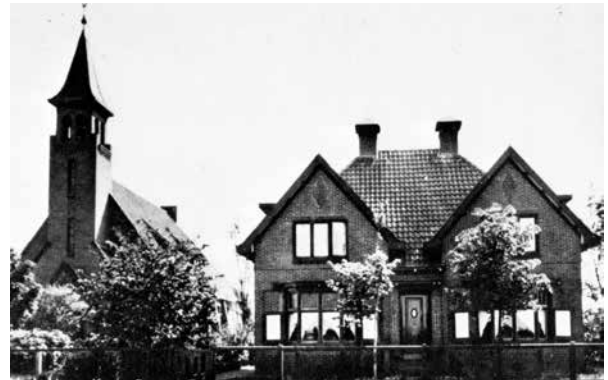
Kerk en pastorie van de Nederlands-Hervormde Kerk in Barger-Compasuum aan het Verlengde Oosterdiep

De volgende digitale nieuwsbrieven over Gemeente Emmen 1940-1945 verschijnen omstreeks 27 april 2023 en 3 mei 2023.