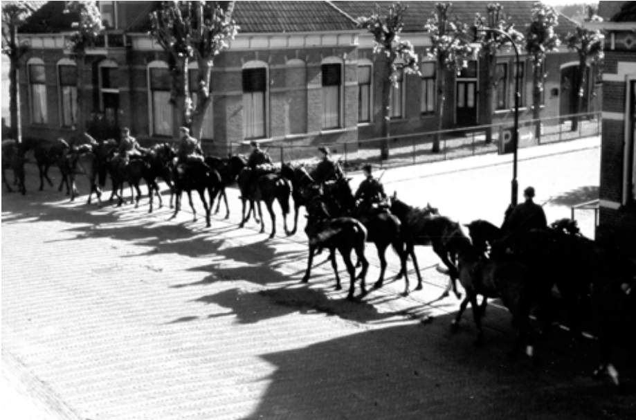
Door de Hoofdstraat rijden Duitse militairen op hun paarden.