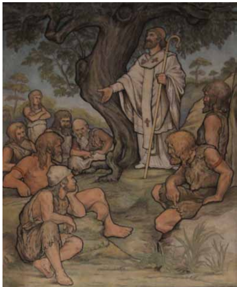
Prediking Willebadus. Een wandschildering in de voormalige statenzaal in het huidige Drents Museum

En dan drie dagen na dit lentefeest in 773, op de 20ste dag van Donar, werden de Angelen en de Oeveren door vreemde krijgers gedwongen om naar een van hun heilige plaatsen, in dit geval de dikke eik halverwege hun nederzettingen, te komen. Hier zagen zij een man in een wit gewaad met een staf staan, omringd door vele vreemde krijgers die zich tussen de bosschages wat hadden teruggetrokken. De man nodigde hen uit om rond hem