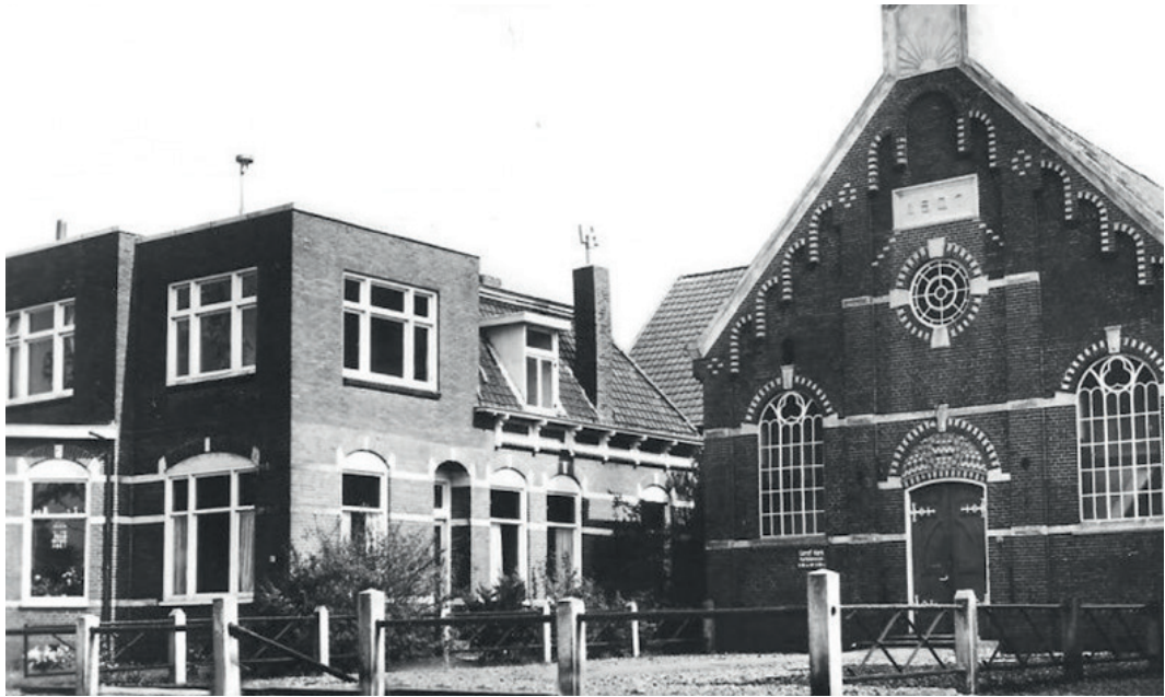
Gereformeerde kerk Nieuw-Weerdinge met pastorie