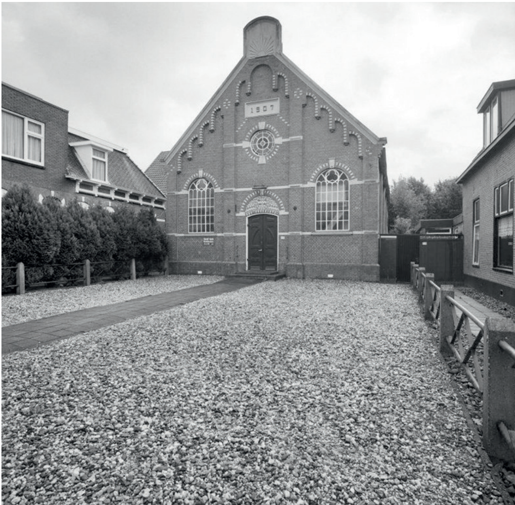
Gereformeerde kerk Nieuw-Weerdinge