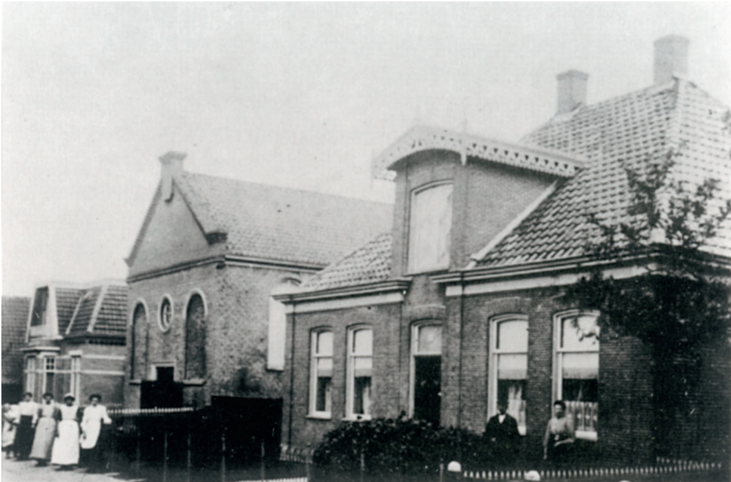
Gereformeerde kerk Coevorden

6 december 1842 preken in de boerderij van de rijke jonge weduwe Jantje Frieling-Joling in het dorpje Noordbarge bij Emmen. Dat kwam ook de Coevordenaren ter ore, zodat men erop uittrok om de predikant in levenden lijve te horen. Ze nodigden ds. Medema toen uit ook in Coevorden te komen preken. In de locatie van Herberg De Loo, net buiten de stad, omdat men ongeregeldheden verwachtte, werd een dienst gehouden. Veel nieuwsgierigen kwamen naar 'die Cockse dominee' luisteren. Tegenstanders probeerden de godsdienstoefening te verstoren, maar succes hadden ze niet. Na deze dienst werd door een groep van zeventien kerkleden van Coevorden een Acte van Afscheiding opgesteld die enkele dagen later aan de kerkenraad van de Hervormde gemeente werd gebracht. Daarmee was de Afscheiding van Coevorden begonnen op 6 december 1842. Maar er was nog geen gemeente geïnstitueerd. Dat gebeurde op 2 februari 1843 toen een nieuwgekozen kerkenraad werd geïnstalleerd, waarmee de officiële stichting van de Afscheiden gemeente Coevorden een feit was.