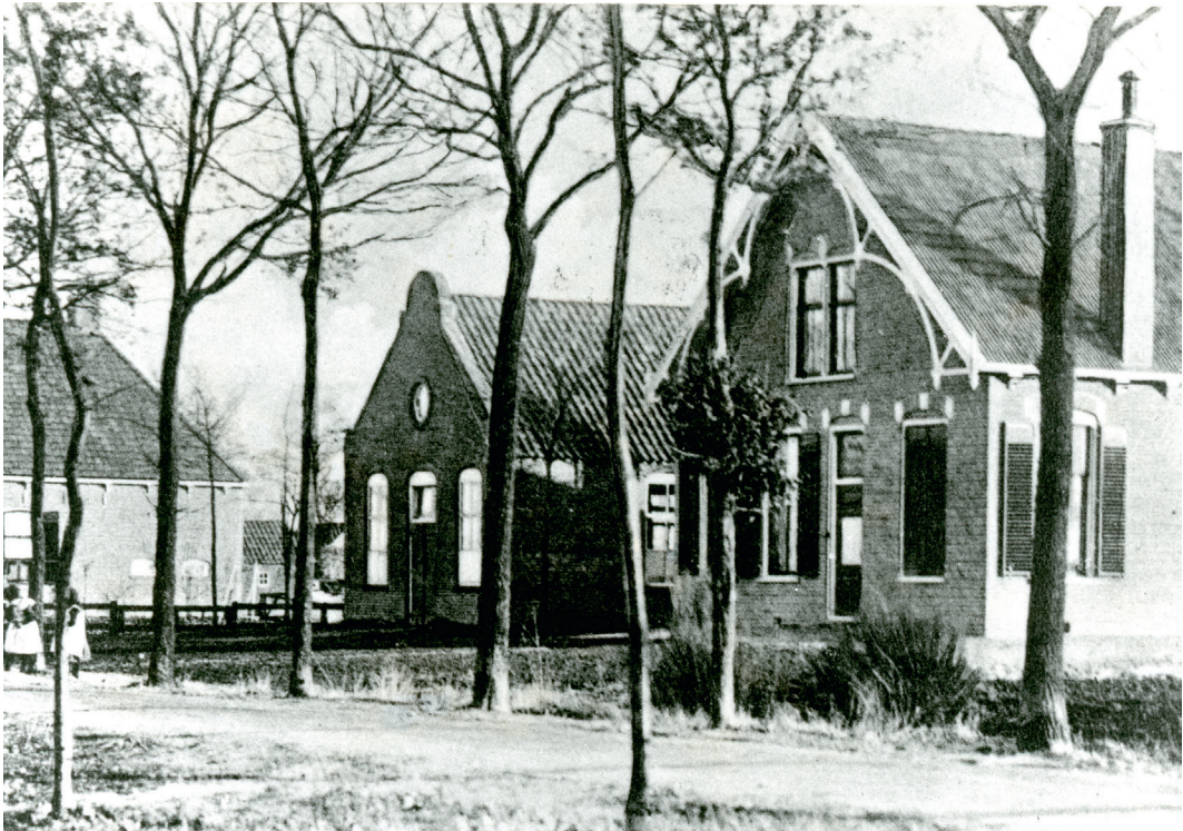
Gereformeerde kerk Schoonoord met pastorie