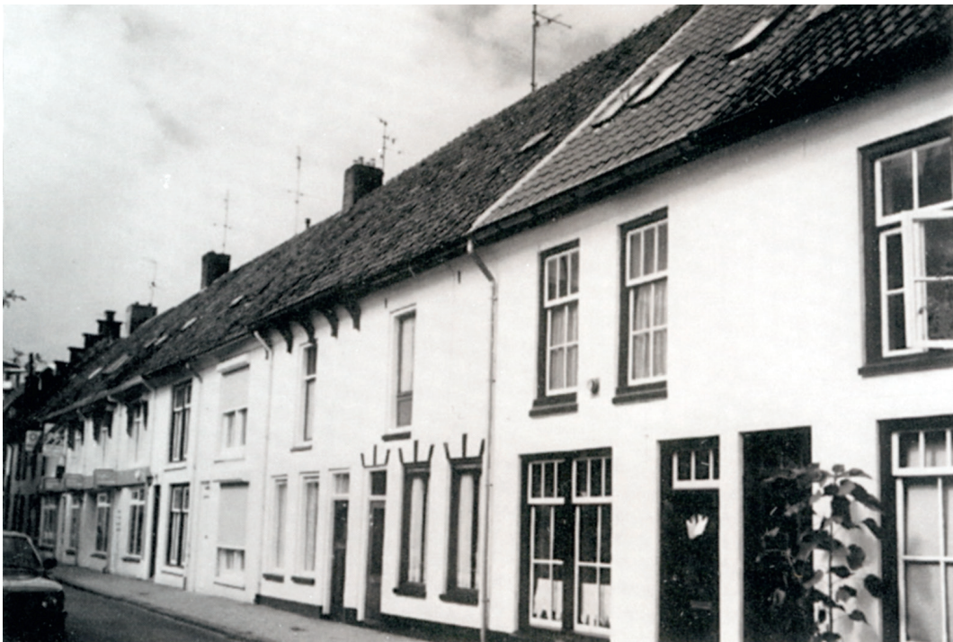
Samenkomsten in één van de huizen op de zolder