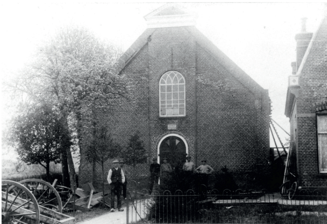
Gereformeerde kerk Roden

Deze gebeurtenis hield veel verband met de kerk in het Groningse Zevenhuizen, dichtbij Leek. In die gemeente waren meerdere Afscheidenen uit Roden lid. Zij waren intussen