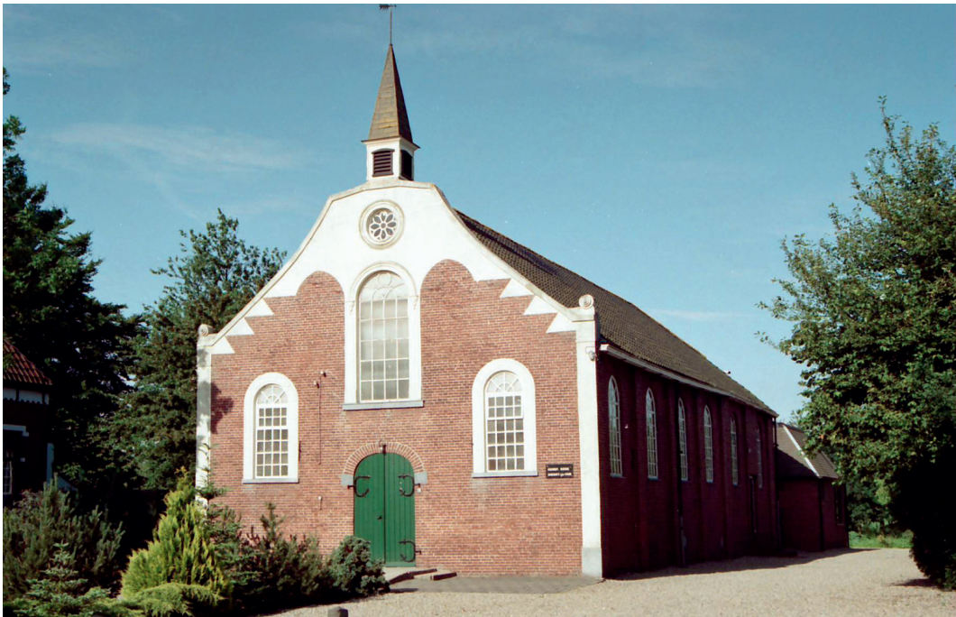
De in 1867 in gebruik genomen en in 1993 afgestoten Gereformeerde kerk te Gasselternijveen

Het einde was echter geen lichte, geen geringe zaak om tot een beslissing te komen. Met vele