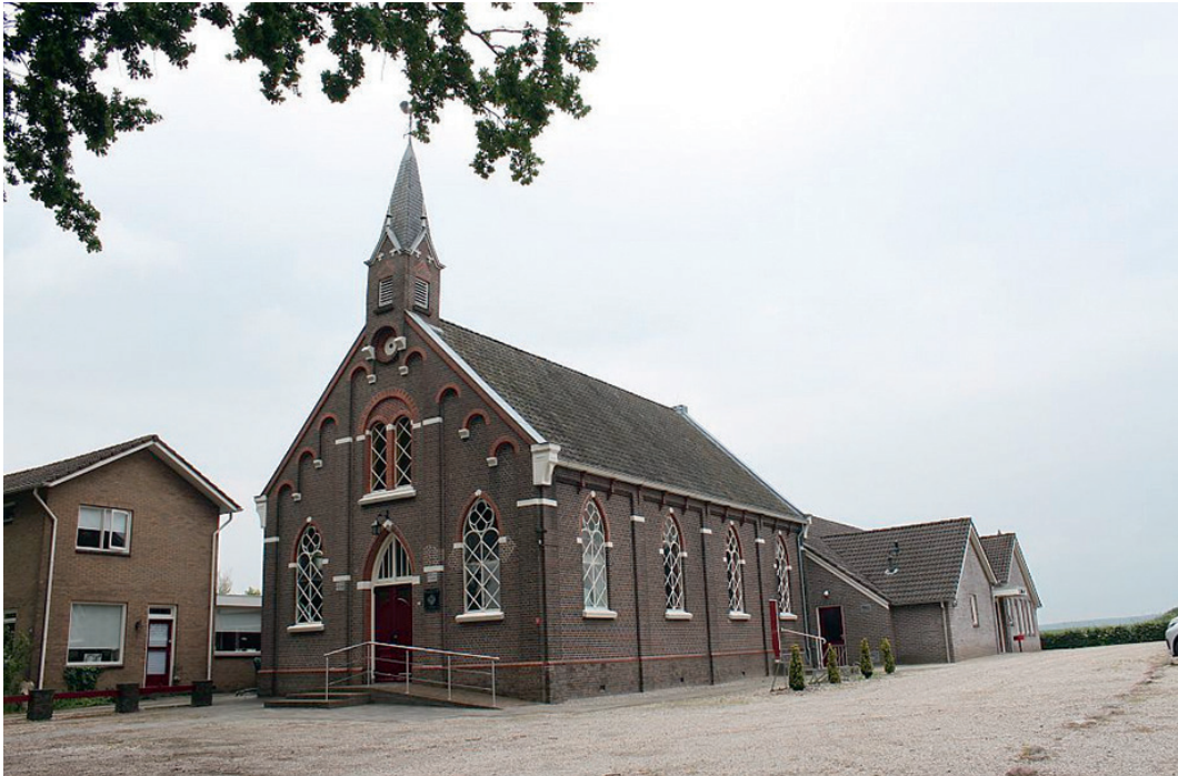
Gereformeerde kerk Schoonoord