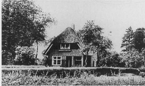
Het woonhuis van Anne de Vries, halverwege Beilen-Hooghalen.