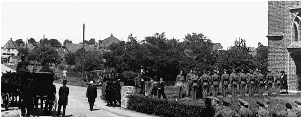
Voor de kerk vormden militairen een erebaag.