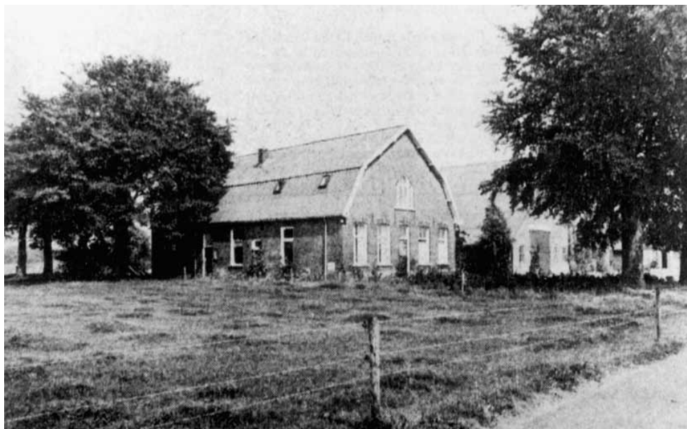
Boerderij familie Rolleman