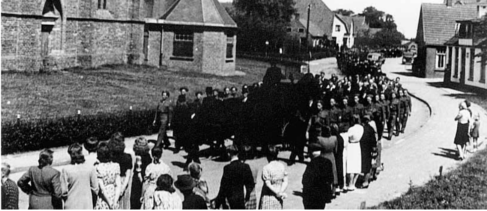
De kop van de begrafenisstoet arriveert bij het kerkgebouw van de Nederlands Hervormde Gemeente.