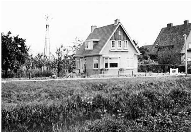
Woning familie Viëtor in Tiendeveen

In september 1940 verhuisden zij naar Tiendeveen, waar zij woonruimte hadden gevonden bij de weduwe Ter Wee. In april 1941 betrokken zij hun nieuwgebouwde ambtswoning.