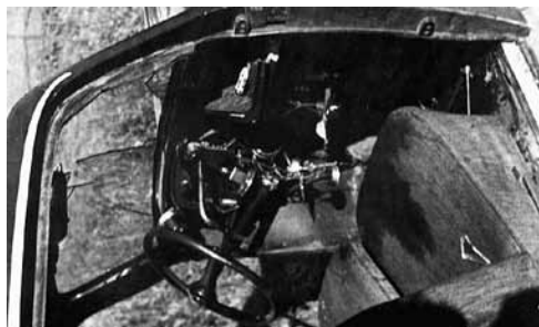
Foto linksboven: Nico Viëtor zat naast de bestuurder. Hij sloeg met zijn hoofd door de voorruit.

Foto rechtsboven: De auto met gasgenerator, waartegen de DKW van Viëtor reed.